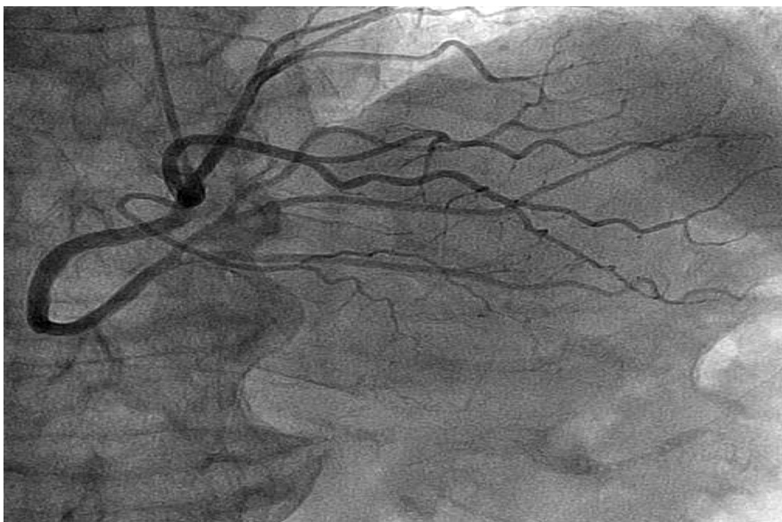
Figura 4. Arteria descendente anterior, circunfleja y derecha sin lesiones significativas.

funcionales de salud de Marjory Gordon se establecieron los siguientes diagnósticos de enfermería NANDA Patrón respiratorio ineficaz (00032), Ansiedad (00146).