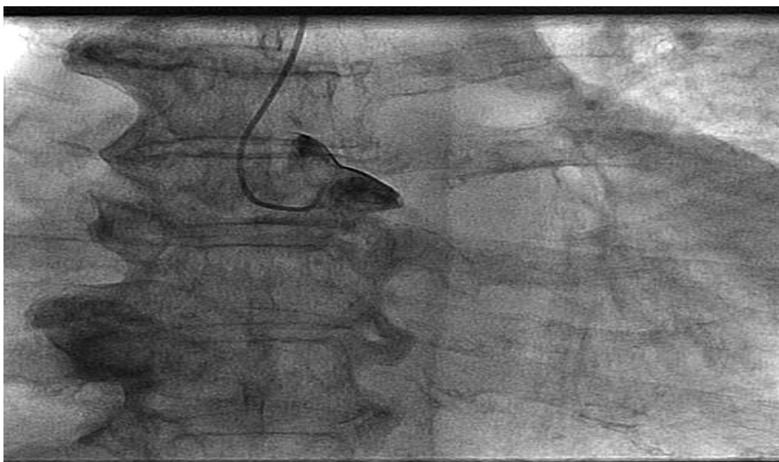
Figura 1. Angiografía con catéter JL3,5.

A continuación, se realizó el diagnóstico angiográfico con catéter JL 3,5 ( figura 1 ) no se logró cateterizar el ostium de la coronaria izquierda, por lo que se cambia por catéter JR4 para cateterizar el ostium de la coronaria derecha.