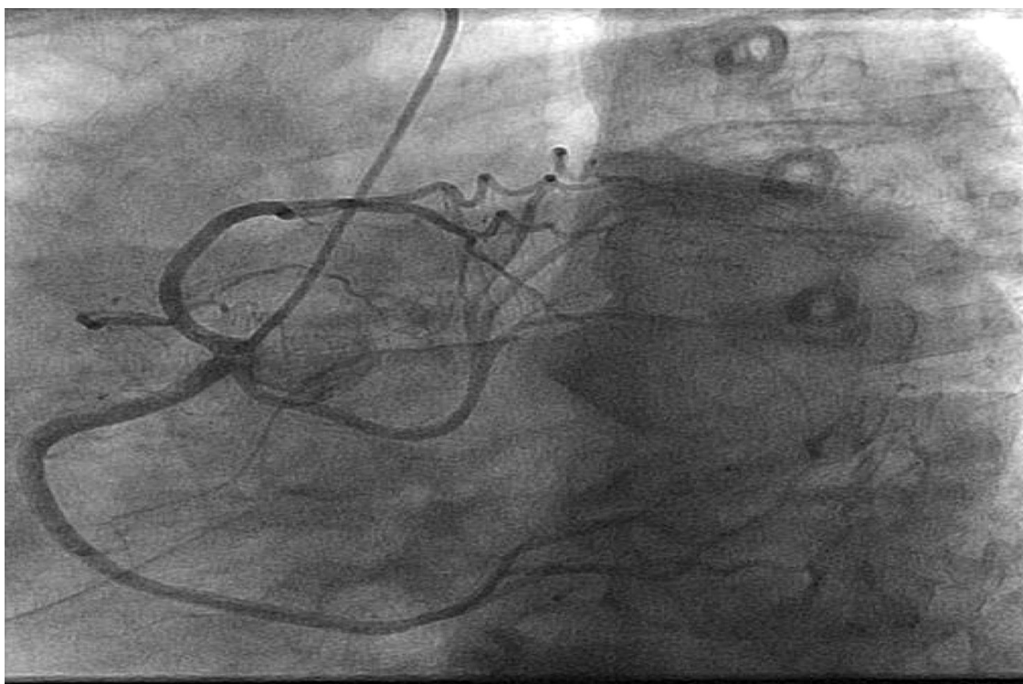
Figura 3. Arteria descendente anterior y circunfleja con salida en el seno coronario derecho.

su imagen corporal ni le preocupan los cambios.