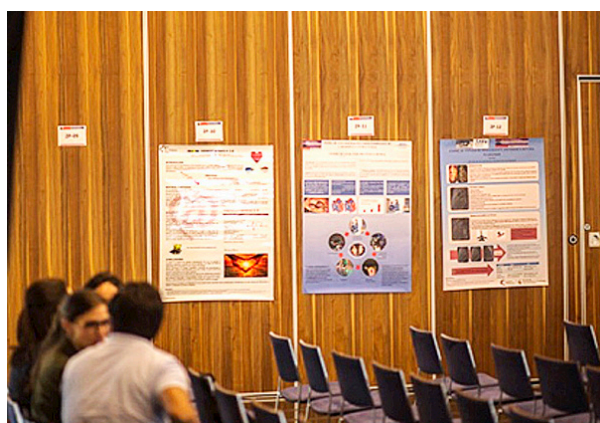
Presentación de Pósteres.