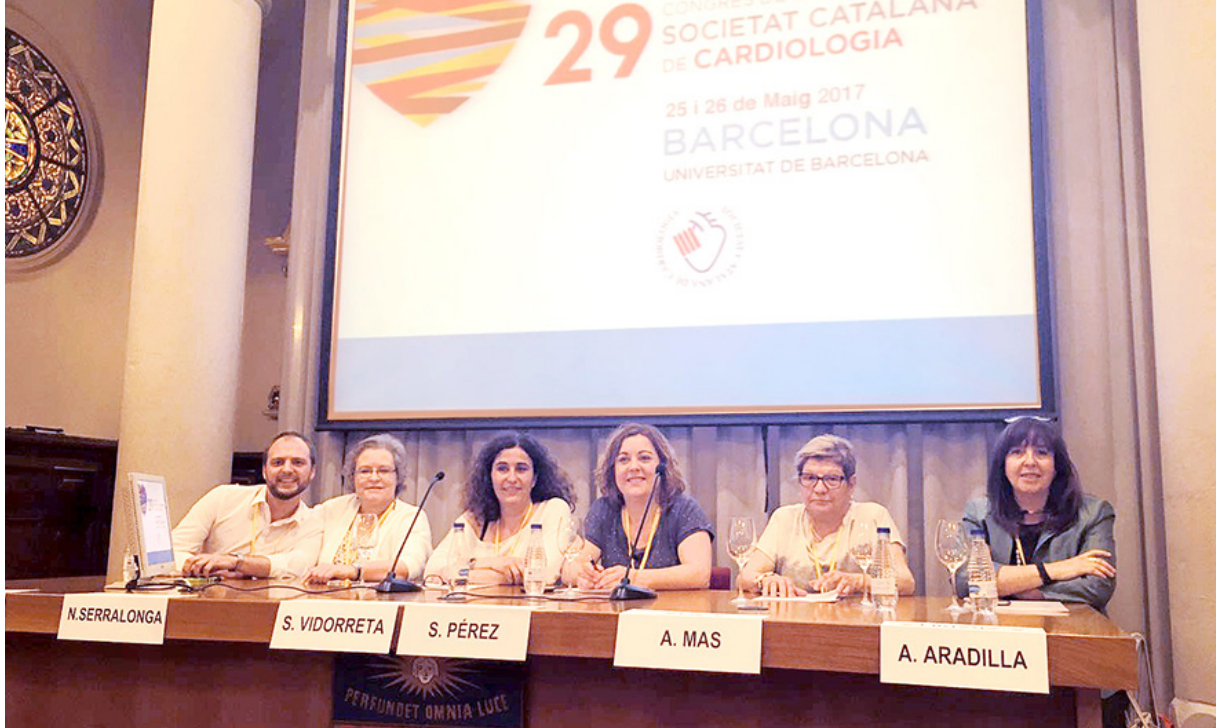
Componentes mesa redonda de Enfermería.