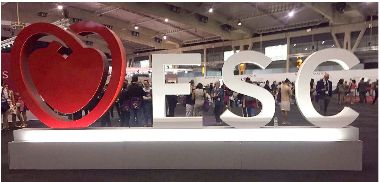
Imagen del logo de la European Society of Cardiology en uno de los halls.