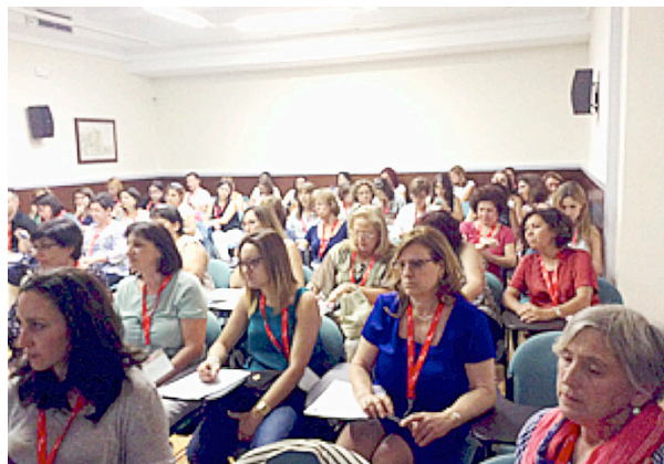
Público asistente a la reunión.