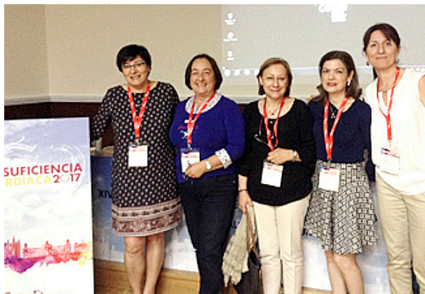
Componentes del Grupo de Trabajo de I.C.