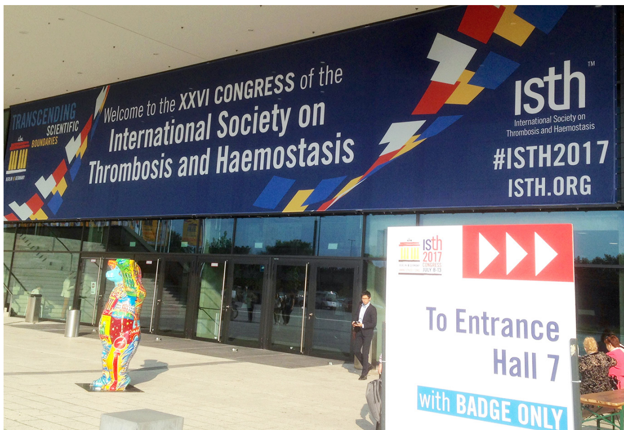
Entrada principal del ISTH Congress.