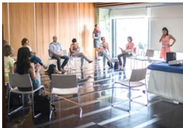
Taller de técnicas de Coaching para el trabajo de equipo.

Esta revista está incluida en los índices bibliográficos: