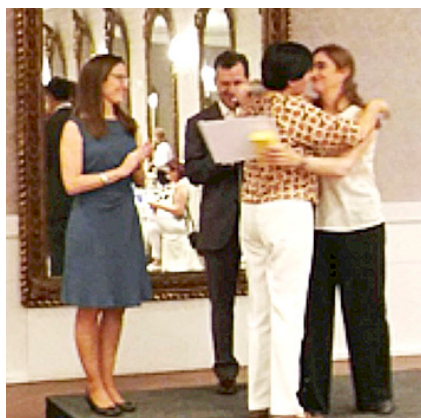
Entrega de premios.

«¿EXISTE RELACIÓN ENTRE EL RESULTADO DEL TEST DE 6 MINUTOS Y LOS FACTORES CLÍNICOS, DEMOGRÁFICOS Y CALIDAD DE VIDA EN PACIENTES DE INSUFICIENCIA CARDIACA DE NOVO CON FEVI \leq 40%?»