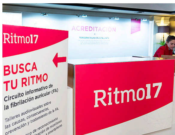
Actividad paralela «Busca tu ritmo».