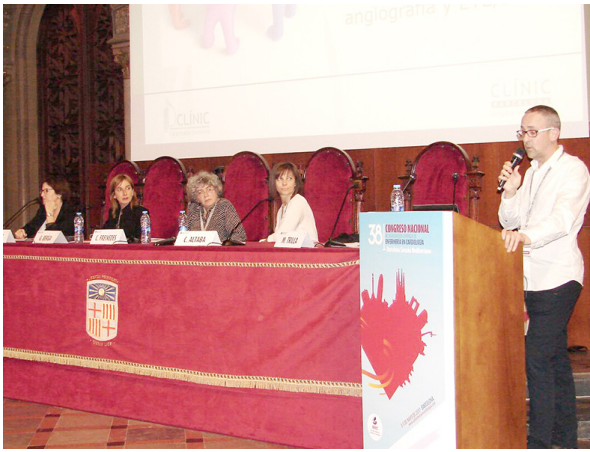
Mesa Redonda: Enfer-cardio-actualidad.