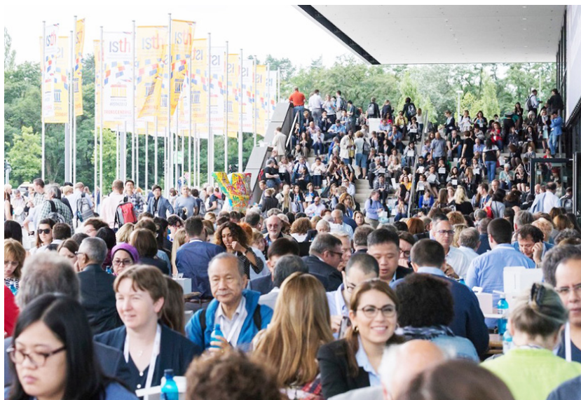
Asistentes durante uno de los descansos del ISTH Congress.

Del 8 de julio al 13 de julio se celebró en Berlín este congreso bianual organizado por la International Society on Thrombosis and Haemostasis (ISTH) , reuniendo a miles de profesionales sanitarios de cientos de nacionalidades en torno a un tema común, la trombosis y la hemostasia. La gran calidad de las comunicaciones presentadas y la buena organización caracterizaron un congreso en el que Enfermería también aportó su granito de arena. Durante dos de los seis días que duró este congreso pudimos disfrutar de sesiones específicas de Enfermería. El primero de ellos se dedicó a ponencias invitadas, bajo el título «Resultados óptimos para pacientes y familiares», donde se debatieron las posibles mejoras en los resultados clínicos que se pueden alcanzar a través de programas de cuidados, a través de la investigación y a través de la educación en poblaciones diversas. El segundo día disfrutamos de interesantes comunicaciones orales de distintos ámbitos relacionados con la trombosis y la hemostasia; como la hemofilia, la trombosis asociada al cáncer, el tromboembolismo venoso, la anticoagulación oral en la fibrilación auricular, y el papel de la enfermera en ensayos clínicos.