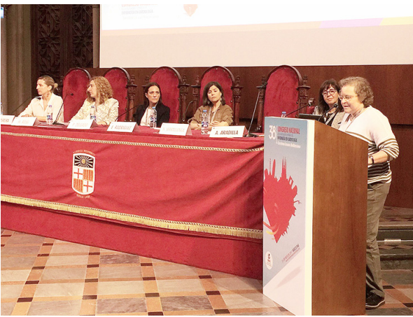
Mesa redonda: Humanización de los cuidados: Paciente, familia y profesionales.