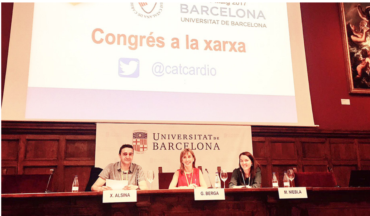
Taller de Electrocardiogramas.