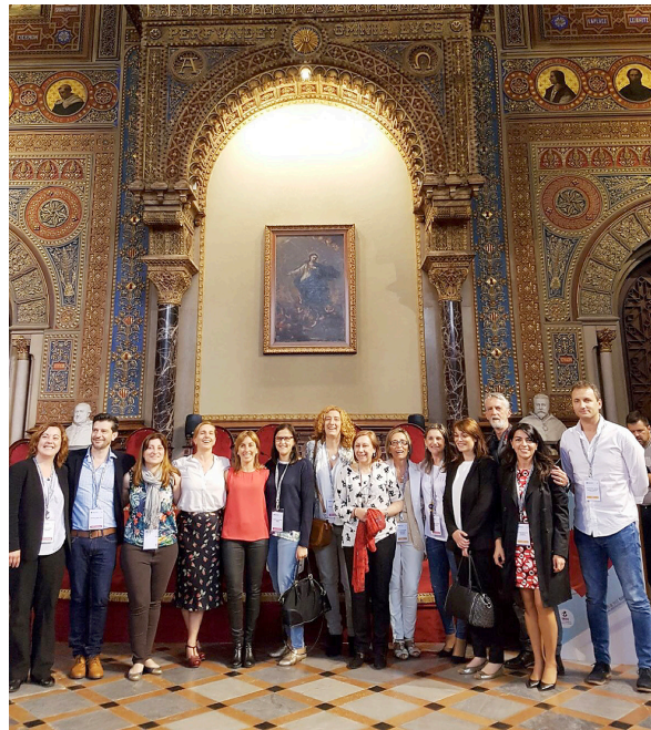
Junta Directiva y Comité Científico de la AEEC.