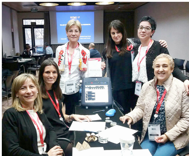
Taller de programadores.

Os animo a todos a participar en «Ritmo18» que tendrá lugar el próximo año en Barcelona.