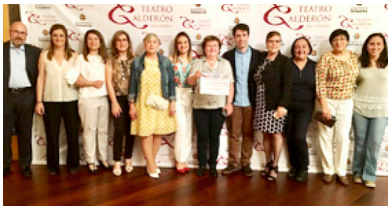
Componentes del Grupo de Trabajo de I.C.