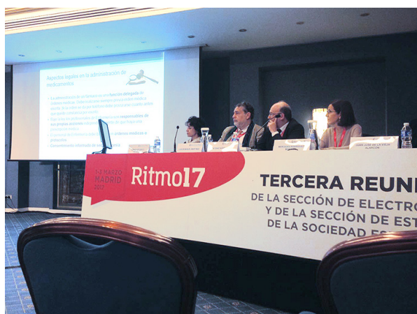
Mesa compartida competencias profesionales.

Esta actividad fue organizada por la FEC , la SEC y la AEEC . El personal encargado de los diferentes